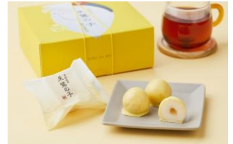
・朱鷺の子 ル・レクチェ 1,404円