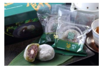
・笹餅クリーム入り 1,404円