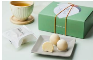
・朱鷺の子 黄身餡 1,350円

※写真は“花火”“黄身餡”“ル・レクチェ”の詰合せとなり中身は季節ごとに変わります