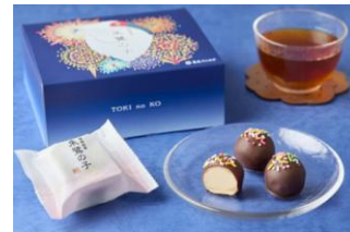
・朱鷺の子 花火 1,404円