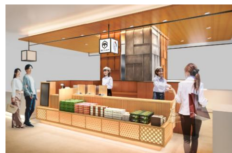
ショップ外観イメージ

【会社概要】新潟県観光物産株式会社 住 所：新潟市江南区亀田工業団地2丁目2番3号 電話番号：0258-381-3421 事業内容：新潟の観光土産品を扱う商社。 公式HP： https://nk-bussan.co.jp/